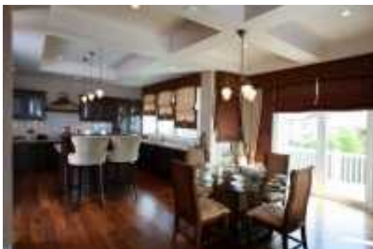
Аренда коттеджей в Подмосковье

Хотелось бы рассказать о нашем окружении. С соседями мы подружились, они очень похожи на нас, живём дружно. Всё они образованные и хорошие люди. Воздух реально чистый, наша старшенькая с мужем переехали к нам во время беременности и теперь наша семья увеличилась. У нас так же есть Лабрадор, собачники меня поймут - для него это собачий рай после московской квартиры»