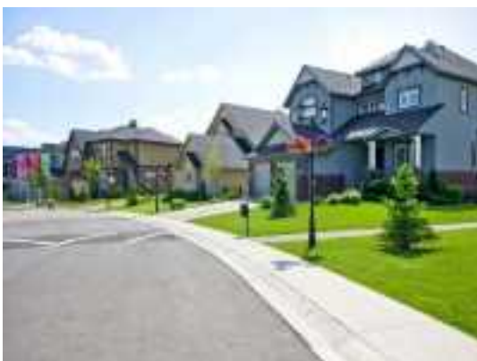
Аренда коттеджей в Подмосковье