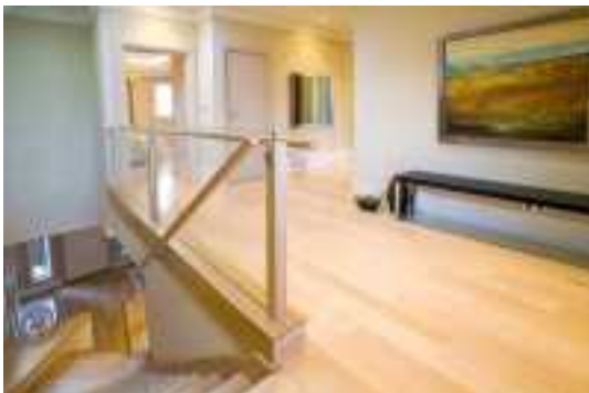
Аренда коттеджей в Подмосковье