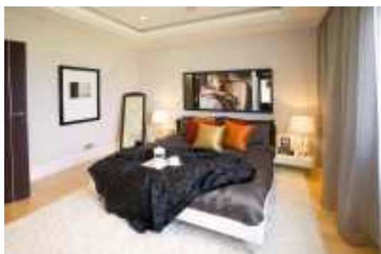
Аренда коттеджей в Подмосковье