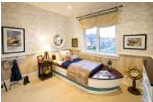
Аренда коттеджей в Подмосковье

В хорошую погоду мой муж часто проводит барбекю, у нас уже стало традицией летом обедать на улице, во время дождя мы обедаем на веранде.