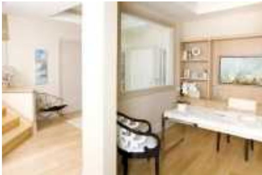
Аренда коттеджей в Подмосковье

хороших результатов, выписывая пируэты (смеётся).