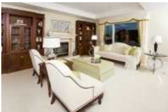
Аренда коттеджей в Подмосковье