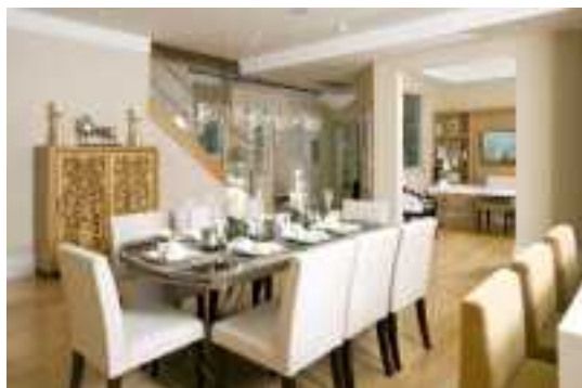
Аренда коттеджей в Подмосковье