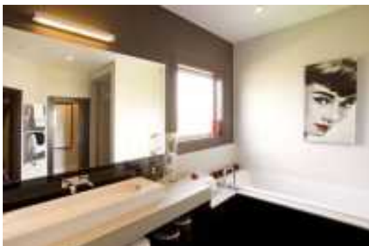
Аренда коттеджей в Подмосковье