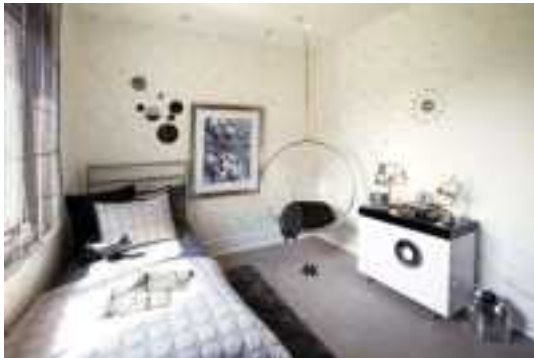
Аренда коттеджей в Подмосковье