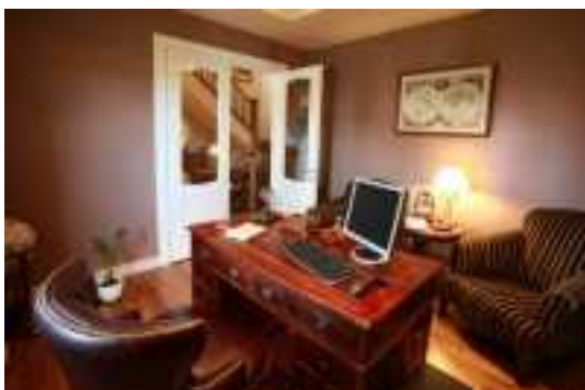
Аренда коттеджей в Подмосковье

Место расположение: Дмитровское направление 2 километра от МКАДа. У нас нет пробок, даже во время дачного сезона. Дорога к нам лежит сквозь лес который является естественным природным фильтром воздуха, ограничивая так же от шума и пыли, обеспечивая свежесть и чистоту воздуха в Вашем доме.