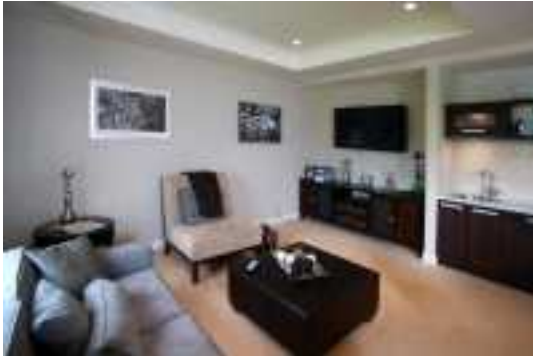
Аренда коттеджей в Подмосковье

наверное псовый рай опосля столичной жилплощади» (Семья из 6-ти человек. Жены с 3-мя детками – отпрыск 11 лет, дочь 20 и 14 лет, внучек (новорождённый) пес и зять.) Этаж: 2