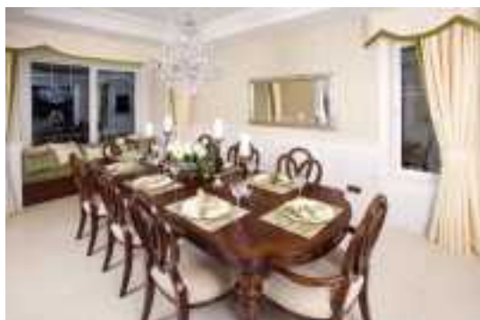
Аренда коттеджей в Подмосковье

приверженцам зимних видов отдыха деятельно действуют ансамбли Яхром, Сорочаны, Свободен.