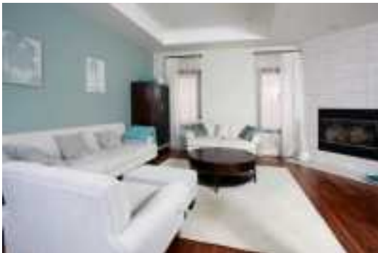
Аренда коттеджей в Подмосковье

наверное псовый рай опосля столичной жилплощади» (Семья из 6-ти человек. Жены с 3-мя детками – отпрыск 11 лет, дочь 20 и 14 лет, внучек (новорождённый) пес и зять.) Этаж: 2