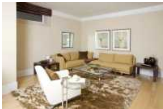
Аренда коттеджей в Подмосковье