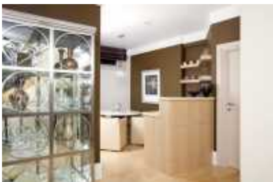
Аренда коттеджей в Подмосковье

(Семья из 6-ти человек. Супруги с тремя детьми – сын 11 лет, дочь 20 и 14 лет, внук (новорождённый) собака и зять.)